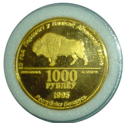
Die „Münze“ zu 1000 Rubel mit dem Feingewicht von einer Unze Gold, Durchmesser 32.6 mm

In dieser schweren Zeit des Finanzchaos und der Hyperinflation unterschrieb die belarussische Sparbank (wohlgermerkt eine kommerzielle Bank und nicht die Nationalbank der Republik Belarus) am 10. April 1995 einen Vertrag mit der amerikanischen Finanzgruppe „IGC-LLC“ aus Houston (Texas) über die Lieferung von Gold- und Silbermünzen im Gesamtvolumen von 50 Millionen Dollar der USA. Über die Laufzeit des Vertrages gibt es leider keine Angaben. Am 20. April 1995, also 10 Tage nach Unterzeichnung des erwähnten Vertrages, beauftragte der Ministerrat der Republik Belarus mit dem Erlaß № 332r das Finanzministerium gemeinsam mit der Nationalbank ein Projekt mit dem Ziel zu erarbeiten, Gedenkmünzen in Gold auszugeben. Und bereits am 17. Mai des Jahres 1995, ohne Abstimmung mit der Nationalbank oder anderen offiziellen Stellen, erhielt die Sparbank die erste Lieferung von Goldmünzen mit Nennwert 1000 Rubel von der Liberty Mint in Provo (Utah). Der Goldgehalt der „Münze“ betrug eine Unze.