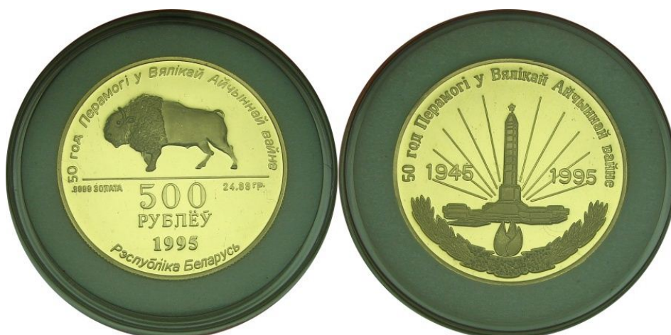
Die „Münze“ zu 500 Rubel wird für etwa 1650 Euro in der BelAgroPromBank angeboten

Nun aber zurück zu der eingangs gestellten Frage: Münze oder Medaille!? Anhand der hier dargelegten Fakten läßt sich ganz eindeutig sagen: Obwohl es auf diesen „Münzen“ Wertangaben und offizielle Staatsbezeichnung gibt, so handelt es sich doch um private Prägungen, wie sie heute jedes große Münzhandelshaus zuhauf verausgabt und unwissende Sammler zu unnötigen Ausgaben veranlaßt. Die hier besprochenen Stücke waren bei ihrer „Erstausgabe“ 1995 kein offizielles Zahlungsmittel der Republik Belarus – und das ist laut Lexikon die Hauptaufgabe einer Münze - und sind es auch heute nicht. Es sind also keine Münzen, sondern bestenfalls münzähnliche Medaillen . Auch möchte ich diesen Stücken den so gerne zitierten Anlagecharakter absprechen, bei den erwähnten Ausgabepreisen muß man schon sehr optimistisch sein was den Goldpreis der Zukunft angeht.