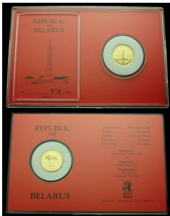
Die „Münze“ zu 125 Rubel im Blister

Der bereits oben erwähnte Angestellte der BelAgroPromBank erklärte, daß bis zum heutigen Zeitpunkt (Ende April 2010) zwischen 460 bis 500 „Münzen“ jedes Nominals (von 50 bis 500 Rubel) verkauft wurden. Zu den Kunden gelangten bisher die qualitativ besten Goldstücke, die Exemplare, die jetzt noch hinter den Schaltern liegen, weisen größtenteils „sichtbare oder erheblich sichtbare Fehler“ auf. Er unterstrich noch einmal den Fakt, daß, entgegen anders lautenden Gerüchten, ausschließlich die BAPB diese „Münzen“ verkauft. Die 1000-Rubel-Stücke wurden 1995 vernichtet, es wird keine weiteren geben.